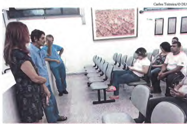
Reunião dos membros da Comissão Eleitoral na Câmara Municipal; novo encontro ocorre nesta segunda