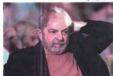
Ex-presidente, Lula; decisão foi tomada durante análise do recurso

A continuação da investigação foi determinada pela maioria dos membros que compõem o Conselho Institucional do Ministério Público Federal -