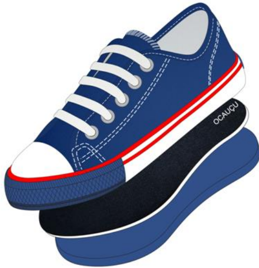
Vista externa (Foto Ilustrativa)

1- COR E MATERIAL DO CABEDAL E LINGUETA - A gáspea do cabedal, laterais e lingueta, deverão ser de lona 100% algodão, de no mínimo 300 gramas por metro quadrado, na cor Azul semelhante ao Pantone 19-4056 TPX, devendo estar dublada com sarja também de 100% algodão desengomado com gramatura mínima de 230 gramas por metro quadrado, totalizando assim um mínimo de 530 gramas por metro quadrado, no conjunto.